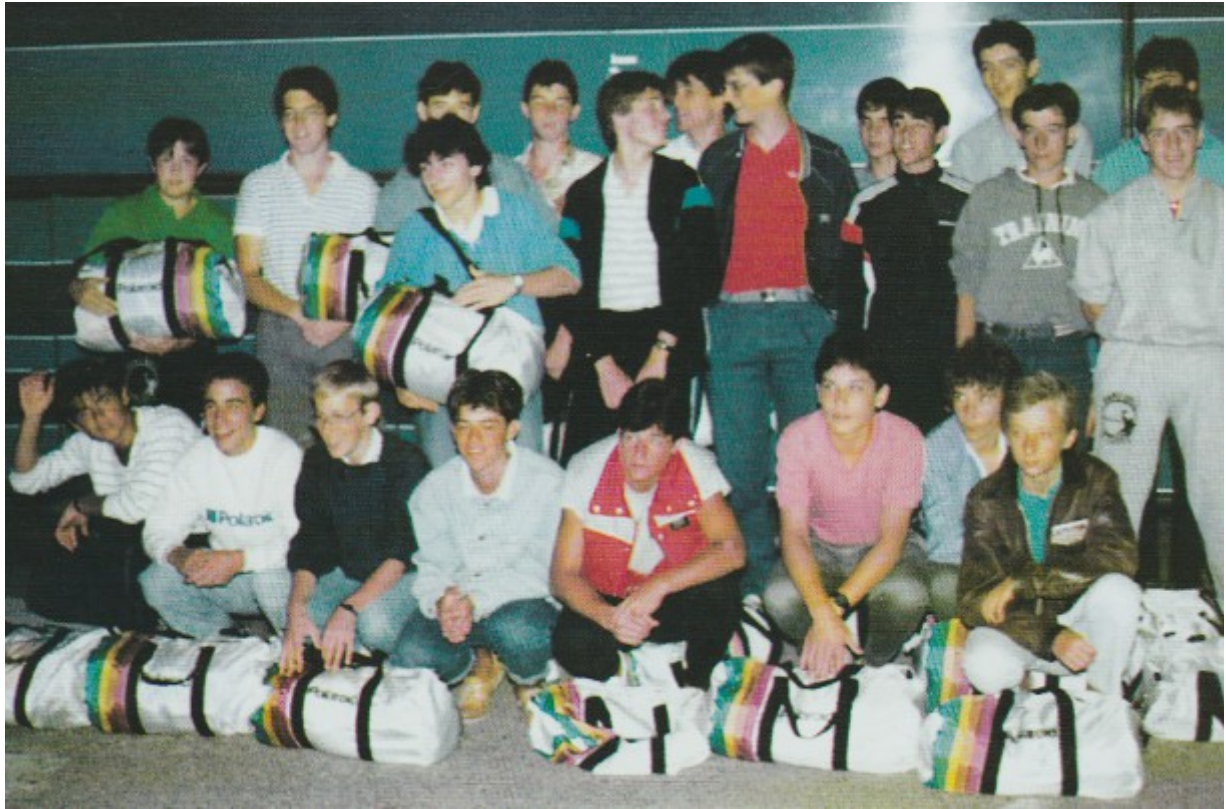
Départ pour le Danemark.