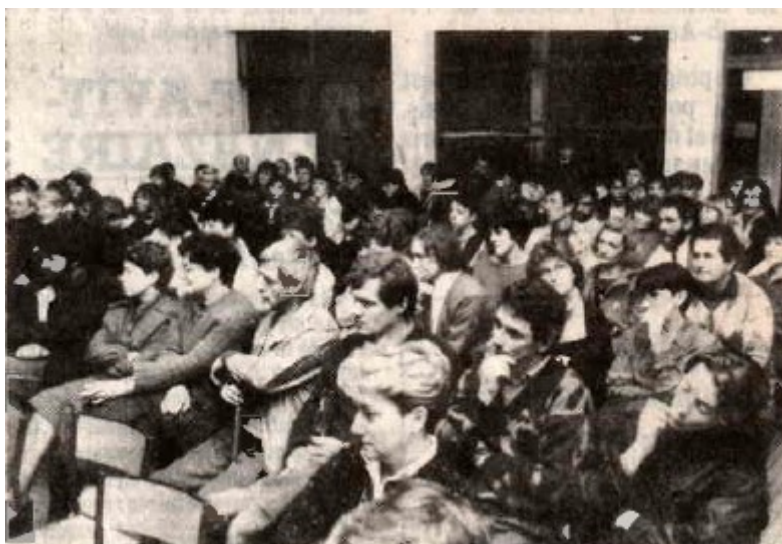
Une salle pleine.

Ragaillardis par la présence de toutes ces personnalités et par l'avalanche de compliments les dirigeants de l'AEH et du HBCL sentent qu'une étape définitive vient d'être franchie. Qu'il ne faut plus regarder vers l'arrière mais vers l'avant, sans appréhension.