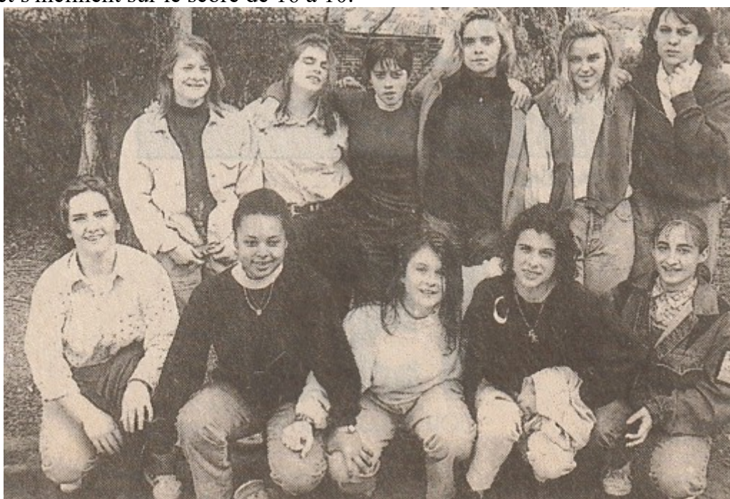
Les vice-championnes d'Académie.

Les cadettes , face à une très bonne équipe de Nay, ne purent jamais prendre l'avantage à la marque. Constatment menées de deux buts, elles craquèrent dans les cinq dernières minutes et s'inclinent sur le score de 16 à 10.