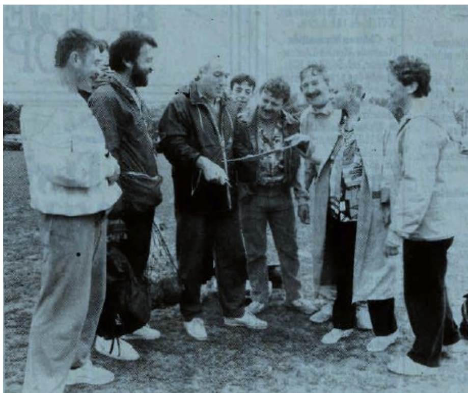
Le staff préparant la journée