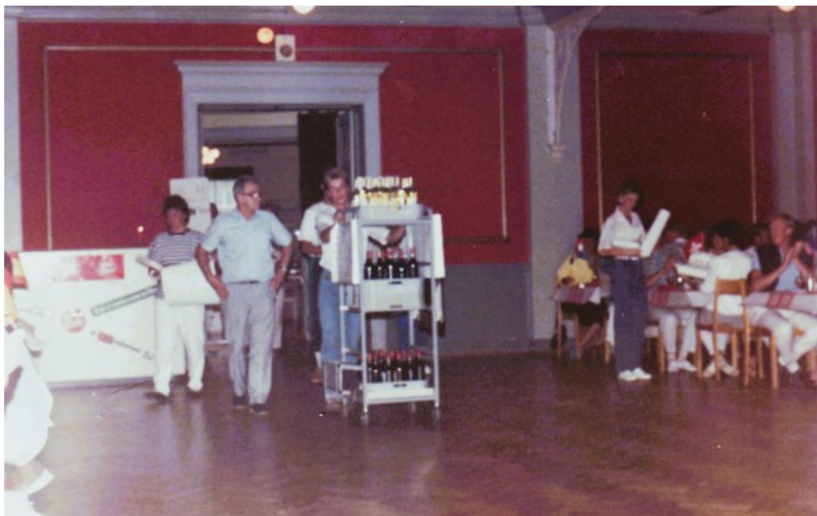
Arrivée du vin offert par le HBCL.

français. Même les chinois font honneur aux Saint Emilion, Pomerol, Fronsac et au sauternes du château Massereau, l'un des sponsors du HBCL pour ce voyage.