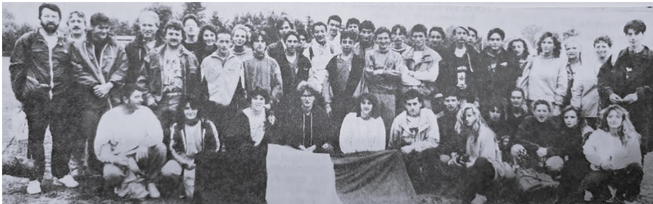
Le groupe des libournais

Un résultat d'ensemble remarquable donc, avec des féminines bien près de l'exploit. Le rêve d'une finale à Randers ne s'est pas réalisé.