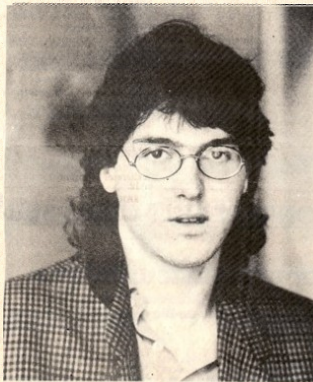
Dix-huit printemps et les portes de l'équipe de France juniors s'ouvrent