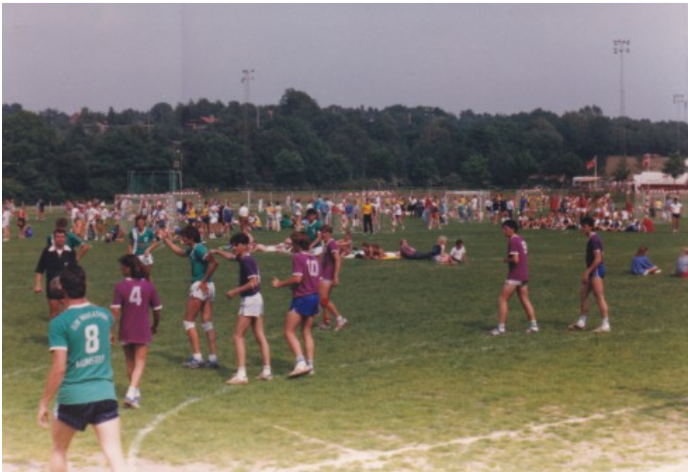
La plaine des sports avec, au premier plan, une équipe libournaise.