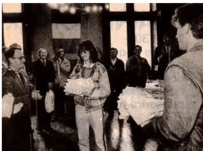
Réception à la Mairie.

Un moment de solidarité internationale appréciable.